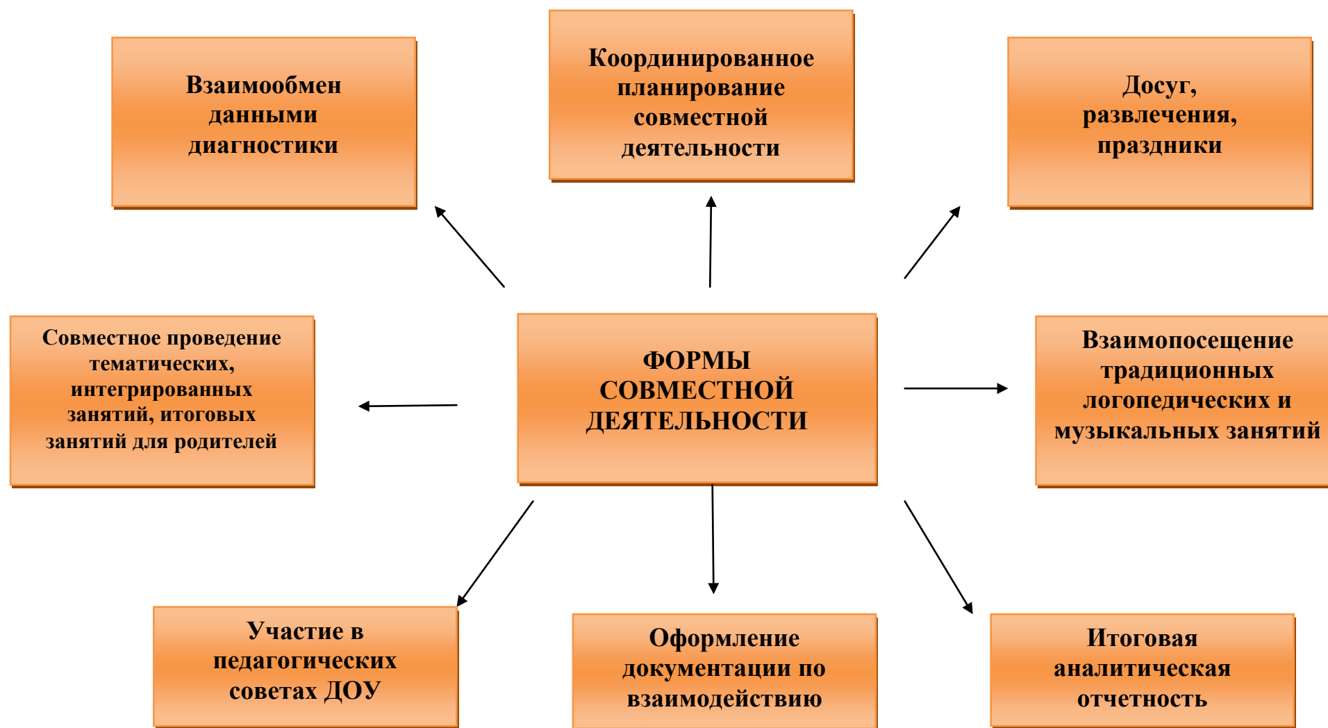
Схема взаимодействия учителя – логопеда и музыкального руководителя