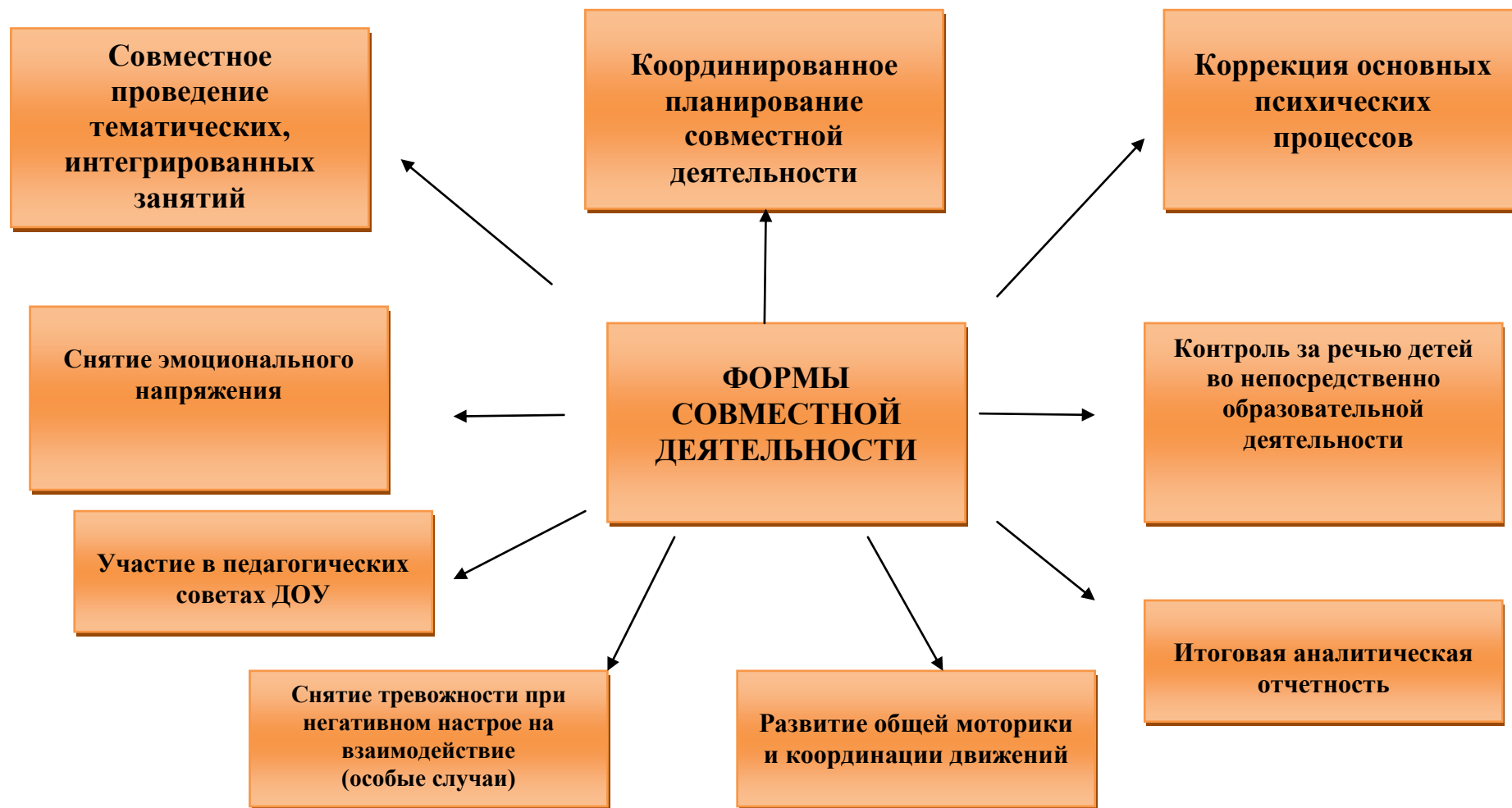
Схема взаимодействия учителя – логопеда и педагога-психолога