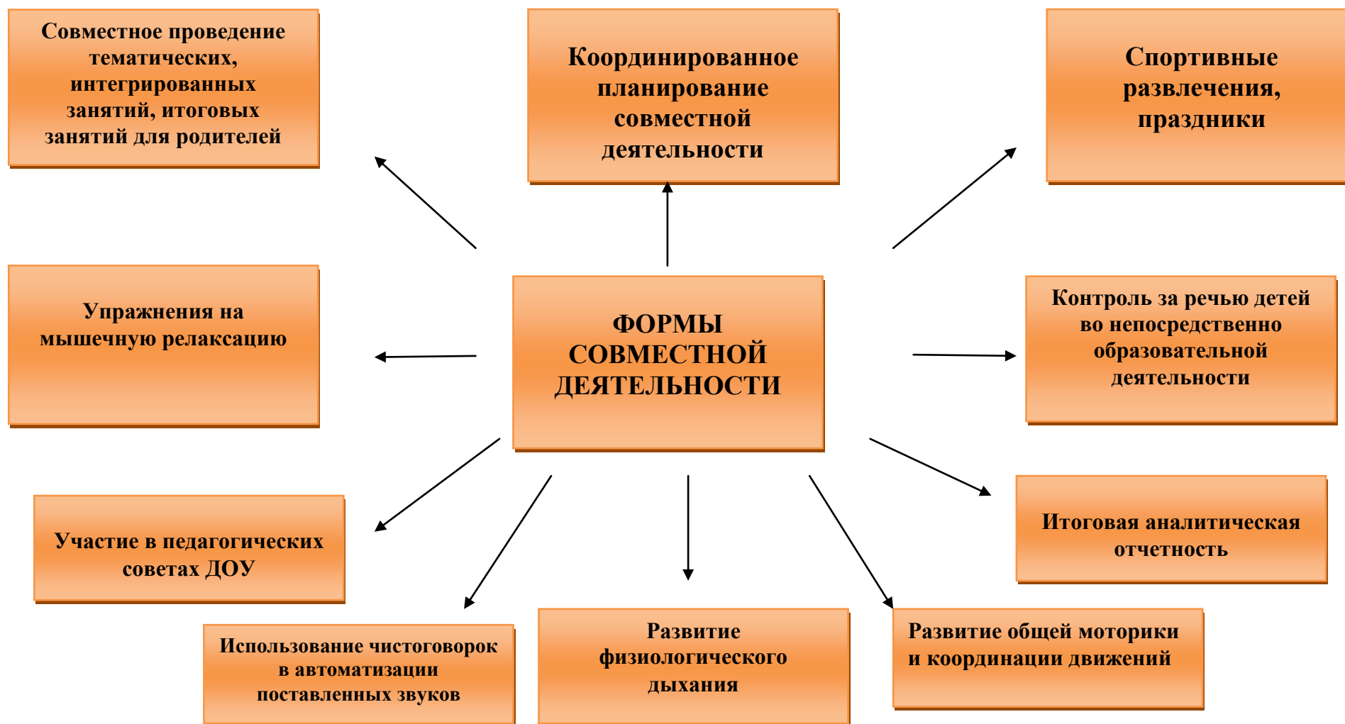
Схема взаимодействия учителя – логопеда и инструктора по физической культуре