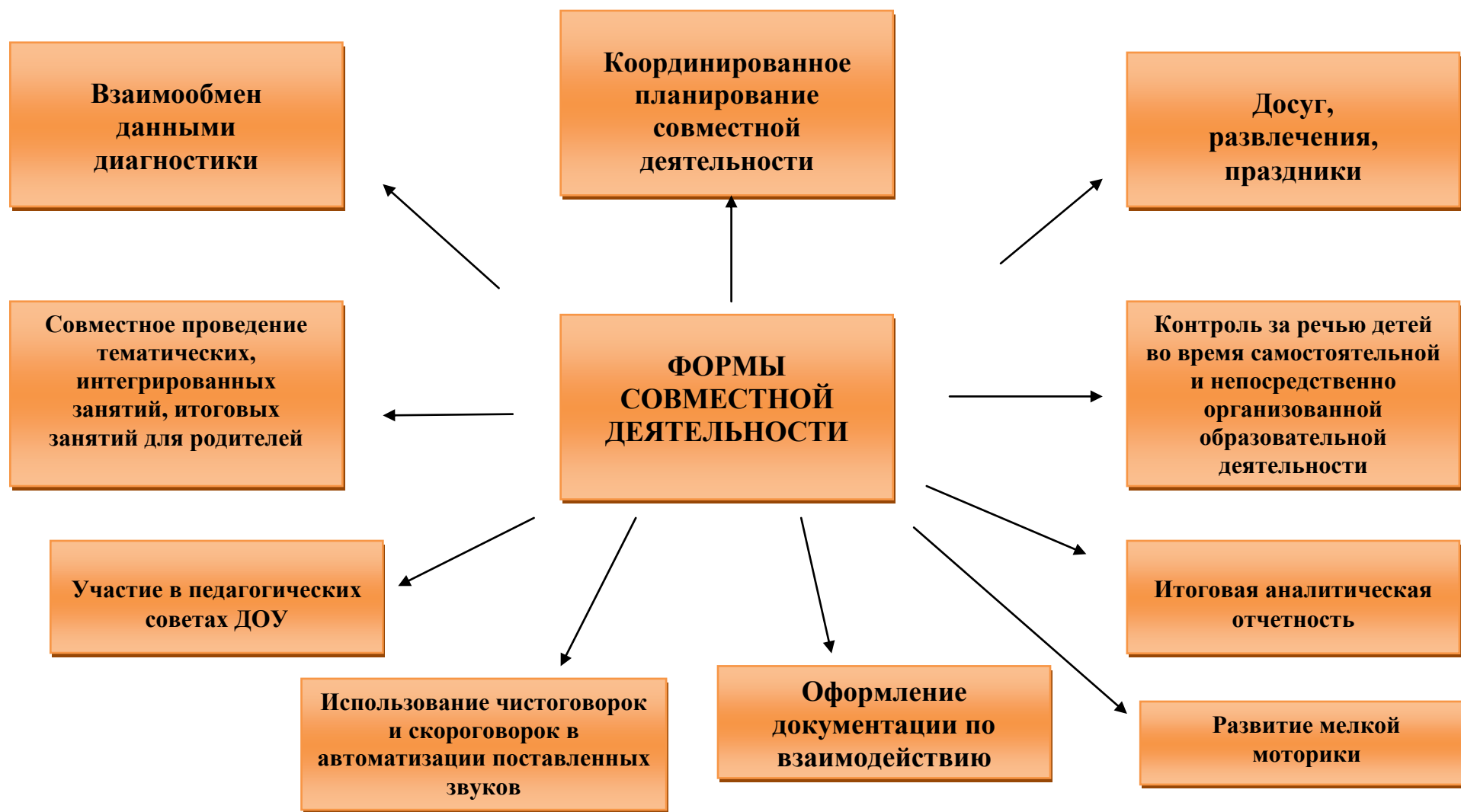
Схема взаимодействия учителя – логопеда и воспитателя